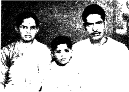
समसाय श्री क. भासा श्री नयलजीन जेन एन समेपनी श्रीमती यदुगबाई